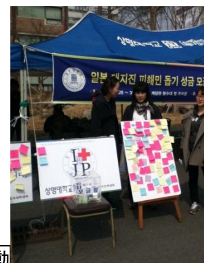
学校での募金活動